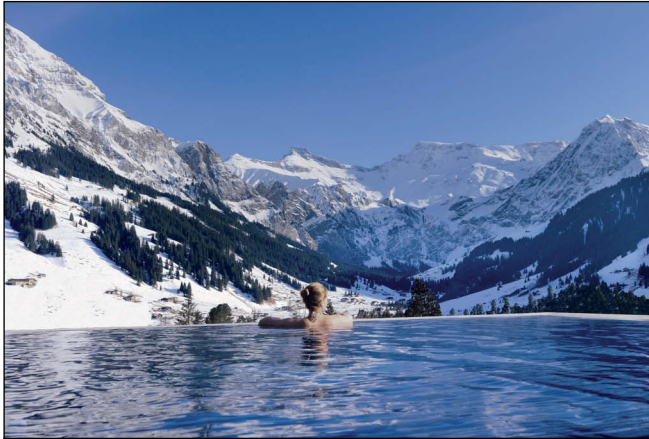
The Times: Der Außenpool wurde weltweit unter die Top 10 Pools mit der besten Aussicht prämiert.