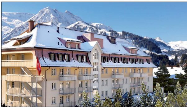
The Cambrian: Gelungene Mischung aus alpiner Authentizität und elegantem Design.

Idyllisch im Herzen des Berner Oberlandes gelegen, ist The Cambrian im Zentrum von Adelboden ein idealer Ausgangspunkt für Ihre Entdeckungstouren. Die Hauptstadt Bern mit ihrem pittoresken Zentrum ist zum Beispiel in einer Stunde, die Wirtschats- und Kulturmetropole Zürich in zwei Stunden zu erreichen.